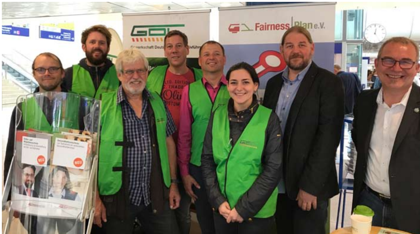
Tag des Zugpersonals

wieder mussten wir auch hier im Norden in Arbeitskämpfe gehen, um unsere Ziele zu erreichen. Unsere Mitglieder haben dies immer unterstützt, egal ob sie bei der AKN, erixx oder wie zuletzt bei den Elbe-Weser Verkehrsbetrieben beschäftigt sind.