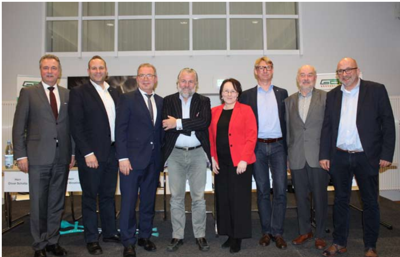
Parlamentarischer Abend 2020 in Barsinghausen mit dem Bundesvorsitzenden Claus Weselsky (links)

Was unsere Tarifpolitik angeht, so sind wir sehr aktiv zum Wohle unserer Mitglieder unterwegs.