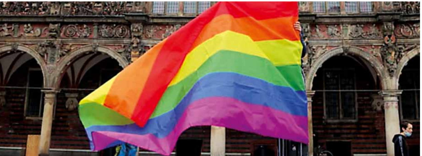
Regenbogen-Fahne vor dem Bremer Rathaus als Sinnbild für die LGBTQ-Gleichstellung.