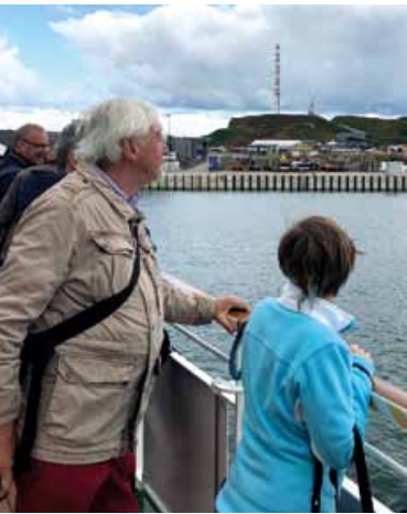
Das vergangene dbb-Sommerfest mit einem Ausflug aufs Meer.

Dienststelle IKK gesund plus Bremen/Bremerhaven, Bremen