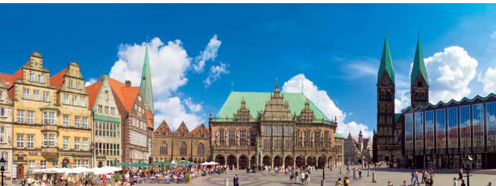
Das Rathaus und die Bürgerschaft auf dem Bremer Marktplatz.