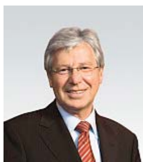
Bürgermeister Jens Böhrnsen

Aufgrund der Wahlergebnisse vom 22. Mai 2011 ist der neue Bremer Senat gebildet worden.