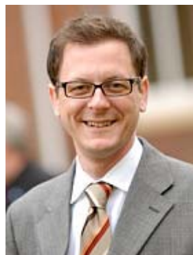
Senator Martin Günthner

Die Senatorin für Finanzen Die Senatskommissarin für den Datenschutz