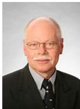
Senator Ulrich Mäurer

Der Präsident des Senats Der Senator für Kultur Der Senator für kirchliche Angelegenheiten